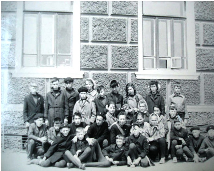
«В родном Улан-Удэ после Пскова»