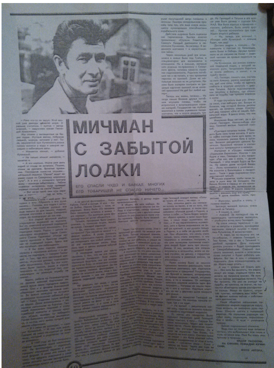
«Статья Ф. Пилюгина»