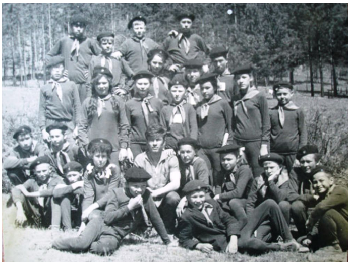
« На Республиканской «Зарнице – 69» ».