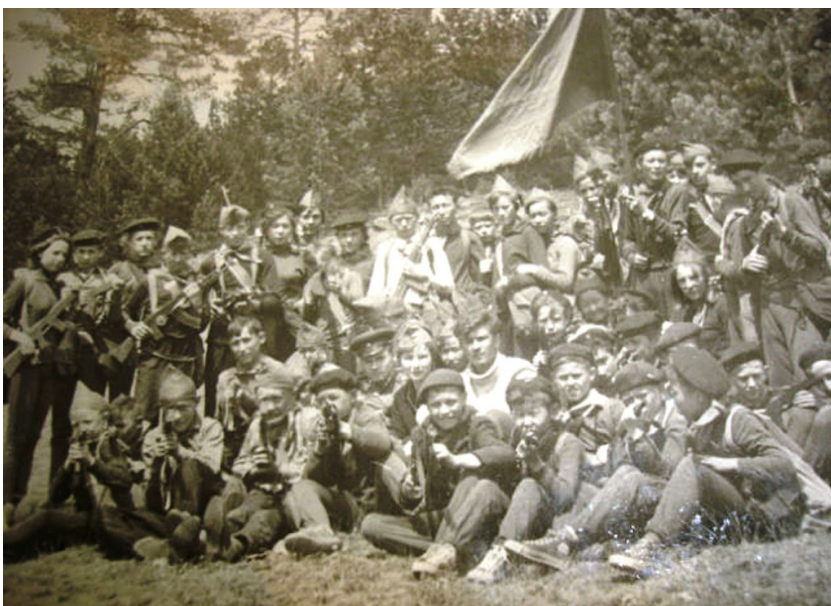
«Победители Республиканской «Зарницы – 69»»