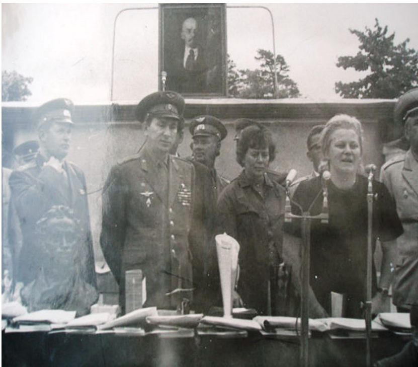
«Летчик-космонавт, Герой СССР, Павел Иванович Беляев»