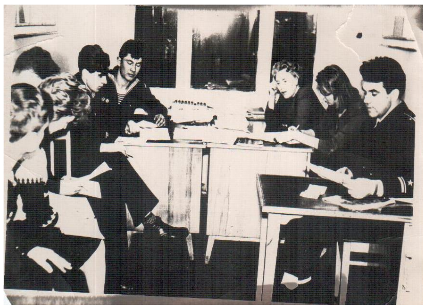
«Подготовка зарничников в г. Мурманск 1968г»